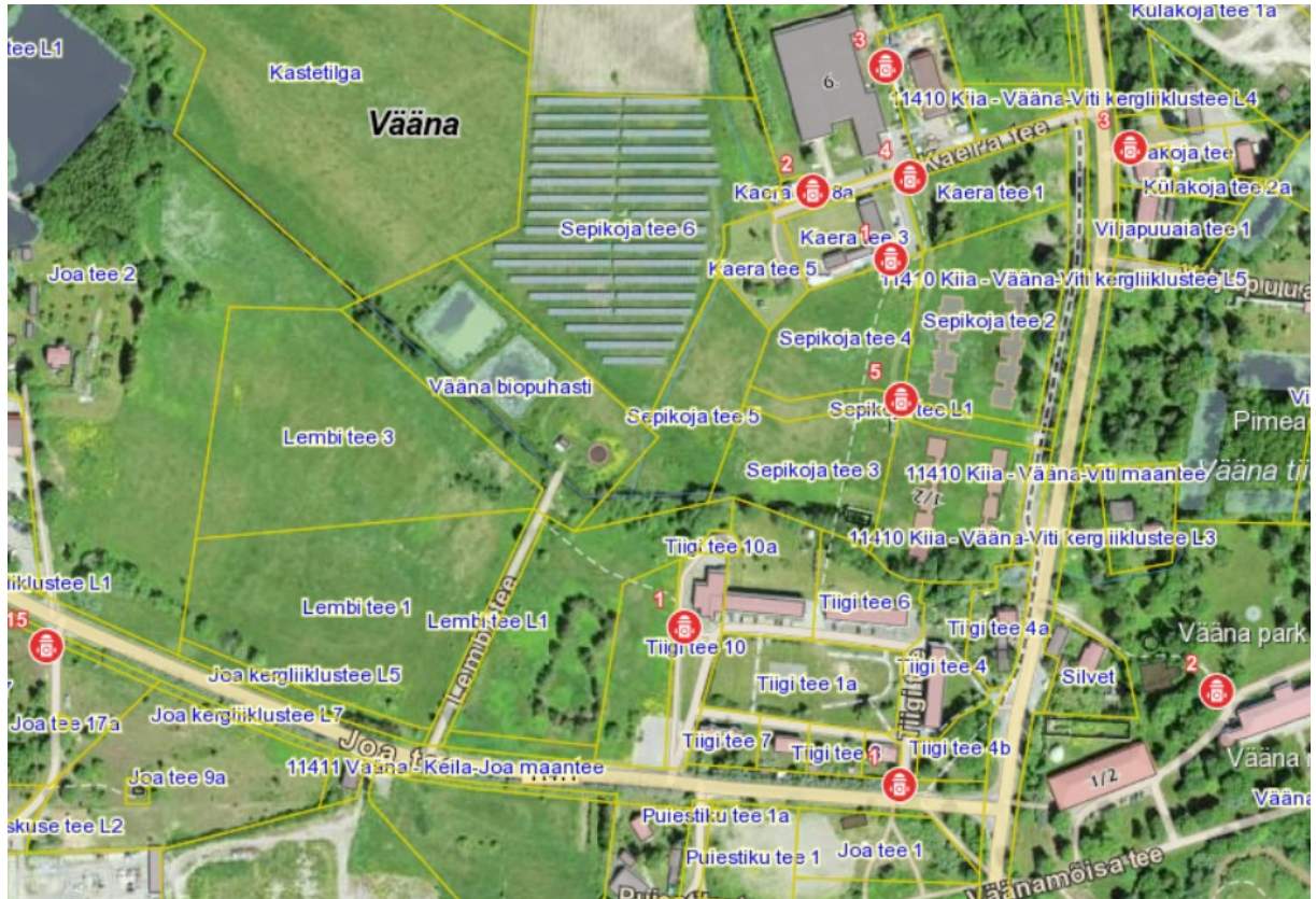
Maa-ameti kaardirakenduse kaart hüdrantide asukohast

Ühisveevärgist tagatakse tuletoorjeksi 10 l/s. Lähim tuletoorje veevõtuhüdrant paikneb Tiigi tee 12 kinnistu piirist u 5 m kaugusel Tiigi tee 10 (katastritunnus 19801:011:1150) maaüksusel.