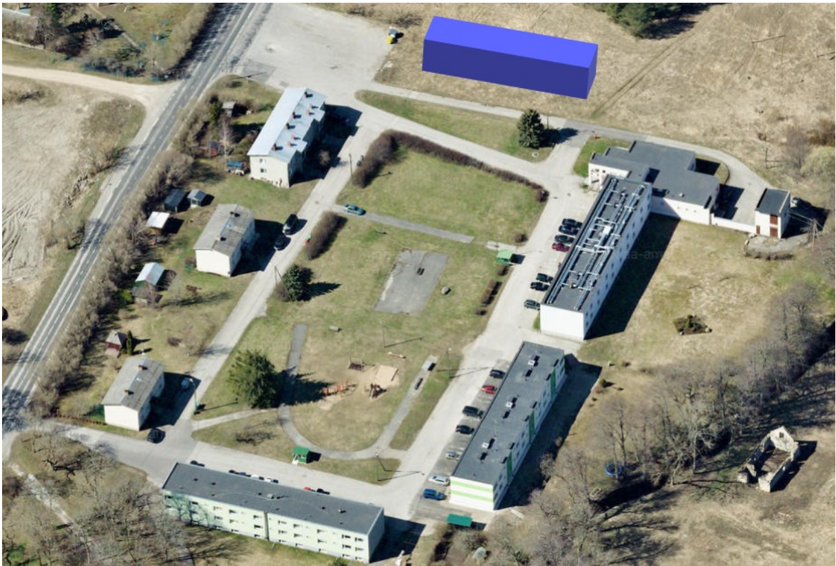
Sinise kastiga tähistatud planeeritava hoone orienteeruv asukoht.

Tiigi tee 12 kinnistu lähipiirkonnas paiknevad olemasolevad mitme trepikojaga 2-kordsed korterelamud, mis on ehitatud 1970-ndatel ja 1980-ndatel aastatel. Kortерelamud on viil- ja lamekatusega hooned. Planeeritavat kinnistut eraldab korterelamutest olemasolev Tiigi tee 10 ärimaa ja Tiigi tee 1a üldkasutatav maa, mis paiknevad planeeritavast alast idas.